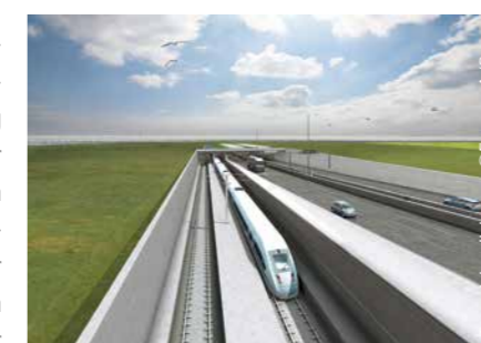
Visualisierung © Femern A/S