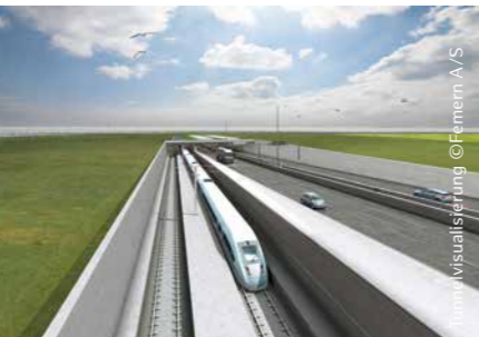
Visualisering © Femern A/S

Hamburg og landene omkring Østersøen har gennem århundreder samarbejdet på det kulturelle, økonomiske og politiske område, og for Hamburg er hele østersøområdet da også en region af stor betydning. En særtstilling indtager det tætte forhold til Danmark, der vil blive endnu tættere, når først den faste forbindelse over Femern Bælt er en realitet.