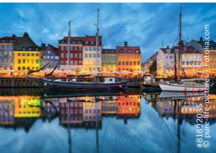
#81692036 © Purefig Pictures - Fotolia.com

For Danmark er Hamburg et godt springbræt til Tyskland og Europa. Hamburgs havn er desuden et strategisk knudepunkt til resten af verden. Omvendt er Danmark porten til de øvrige skandinaviske markeder.